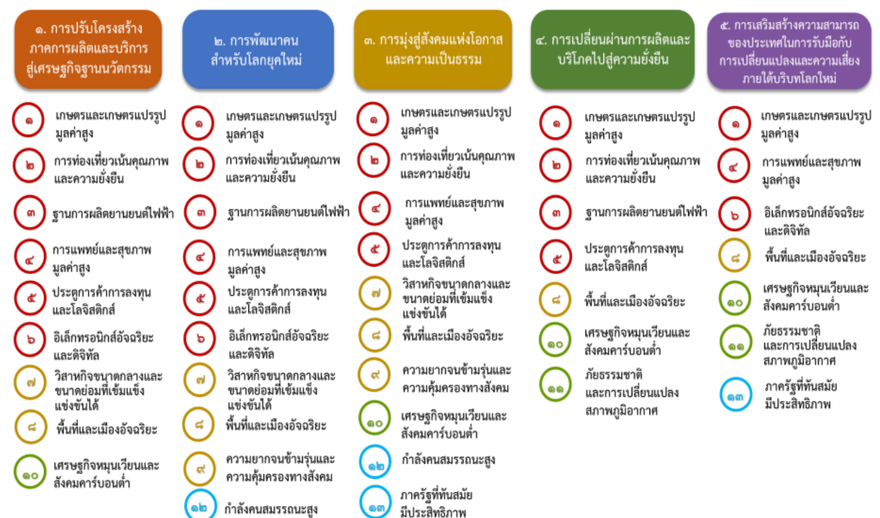
แผนภาพที่ ๓.๑ ความเชื่อมโยงระหว่างหมวดหมู่การพัฒนากับเป้าหมายหลัก

ความเชื่อมโยงระหว่างหมวดหมู่การพัฒนากับเป้าหมายหลักแสดงไว้ในแผนภาพที่ ๓.๑ โดยหมวดหมู่การพัฒนาที่กำหนดขึ้นเป็นประเด็นที่มีลักษณะเชิงบูรณาการที่ครอบคลุมการพัฒนาตั้งแต่ในระดับต้นน้ำจนถึงปลายน้ำ และสามารถนำไปสู่ผลพัฒนาทั้งในมิติเศรษฐกิจ สังคม ทรัพยากรธรรมชาติและสิ่งแวดล้อมไปพร้อมๆ กัน ทำให้หมวดหมู่แต่ละประการสามารถสนับสนุนเป้าหมายหลักได้มากกว่าหนึ่งข้อ นอกจากนี้การพัฒนาภายใต้แต่ละหมวดหมู่ไม่ได้แยกขาดจากกัน แต่มีการสนับสนุนหรือเอื้อประโยชน์ซึ่งกันและกัน